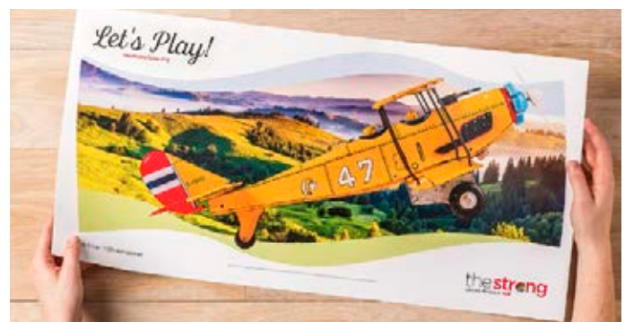
Afdrukken op extra lange vellen – maximum papierformaat 330 x 660 mm

Alles bij elkaar leidt dit tot betere marges, hogere winsten en het vermogen om strategisch te groeien met een enkele investering die berekend is op de toekomst.